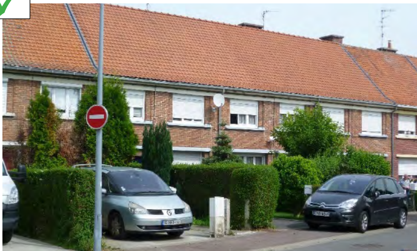
1 place de stationnement par jardinet et préservation du végétal