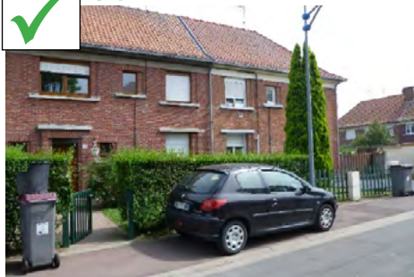
Haie végétale en limite de jardinet de hauteur cohérente avec celle des voisins