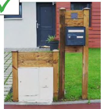
muret technique en bois intégrant les coffrets des concessionnaires et la boîte aux lettres. Jardinet avec un espace de stationnement en pavés avec joints enherbés perméables plus qualitatif de que l'enrobé et un espace enherbé