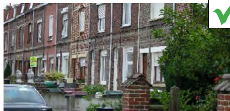
Jardinets clôturés avec des murs en maçonnerie de briques doublés de haies végétales et avec arbustes de temps en temps