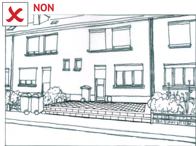
Revêtement en dalles imperméables sur toute la surface, suppression du végétal, des clôtures