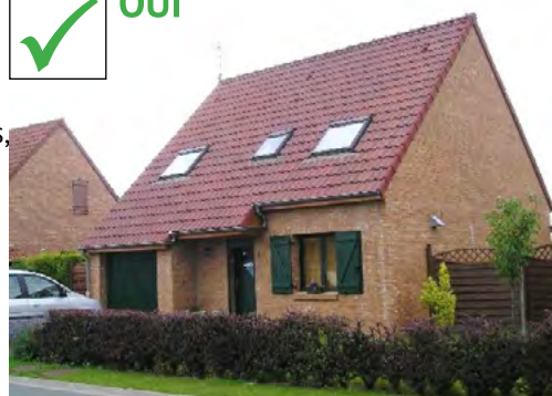
Alliance harmonieuse entre stationnement et végétation