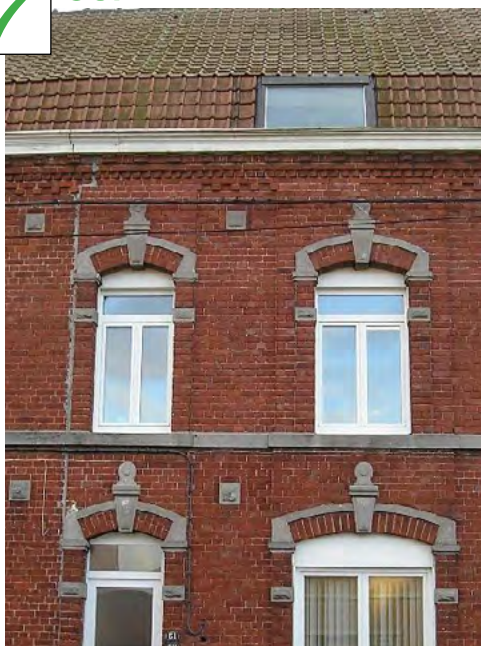
Joints discrets, ton sur ton par rapport à la brique mettant en valeur l'ensemble des décors de façade : cordons, marquage des linteaux cintrés avec clé de voûte, cabochons, etc.