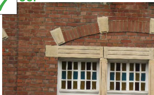
Joints discrets, ton sur ton par rapport à la brique