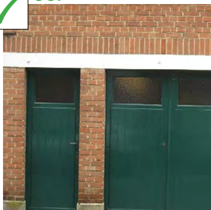
Joints discrets, ton sur ton par rapport à la brique