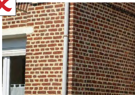
Joints élargis beurrés à fleur et de teinte trop claire : donnent un effet de résille