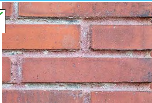
Joints en creux pour les protéger de la pluie ruisselante Joints discrets ton sur ton