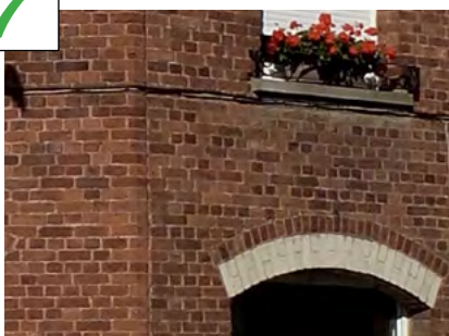
Joints discrets, ton sur ton par rapport à la brique