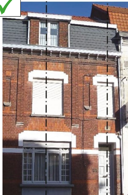
Comble à la mansard habité dont le brisis est en ardoise et le terrasson en tuiles de terre cuite rouge. Fenêtre de toit axée par rapport aux baies de la façade

Couverture : La plus prédominante de la Lys est faite de tuile de terre cuite (panne flamande, puis du Nord) dans la teinte des rouges, tonalité commune avec celle de la brique.