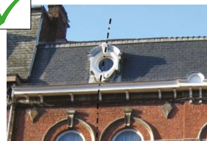
Œil de bœuf axé sur le trumeau situé entre les 2 baies jumelles