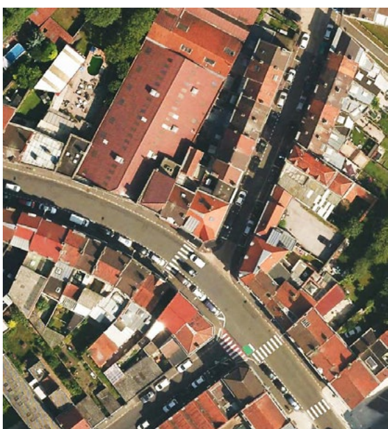
Dominante rouge des couvertures cominoises