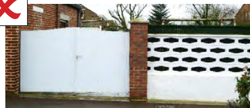
Portail et double clôture pleine et blancs interdits