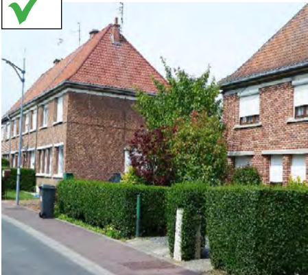
Haie végétale de hauteur coordonnée avec celle des voisins