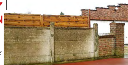
Panneaux béton pleins surmontés de panneaux en bois interdits et hauteurs discontinues >