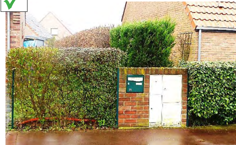
> Murets techniques en brique rouge intégrant boîtes aux lettres, coffrets des concessionnaires et bacs à ordures ménagères