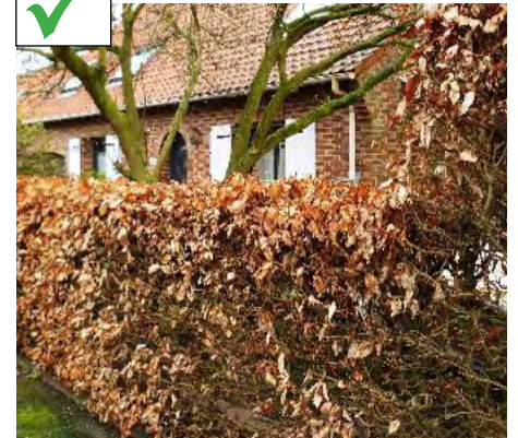
Haie de charmille

Le muret technique intégrant coffrets concessionnaires, boîtes aux lettres et cachant poubelles, dans l'alignement de clôture.