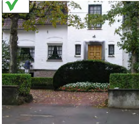
Mur bahut doublé d'une haie