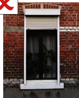
Coffret volet roulant extérieur et cadres blancs au nu extérieur