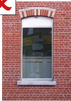
Disparition de l'imposte vitrée remplacée par un panneau plein