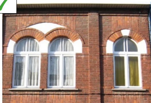
Compartimentage du vitrage respectant la composition des baies maçonnées : hauteur des impostes vitrées respectant celle de la frise maçonnée, profilés des menuiseries des impostes cintrées épousant le cintrage maçonné des linteaux, double petits bois axés.