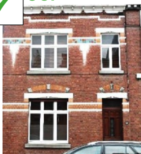
Baies et menuiseries et compartimentage du vitrage axés verticalement et horizontalement, traverses d'impostes vitrées alignées sur les frises décoratives de la maçonnerie