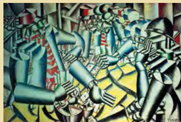
© Fernand Léger, La partie de cartes , 1917

Du 25 mars au 25 avril, à la Médiathèque Ducarin