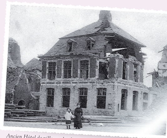
Ancien Hôtel de ville, au lendemain de la Première Guerre mondiale

Sur la base du campanile de l'église, s'inscrit le Monument aux Morts.