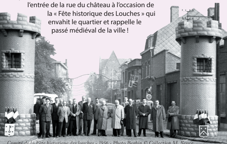
Comité de la Fête historique des louches - 1956

Chaque année, deux simulacres de tours encadrent l'entrée de la rue du château à l'occasion de la « Fête historique des Louches » qui envahit le quartier et rappelle le passé médiéval de la ville !